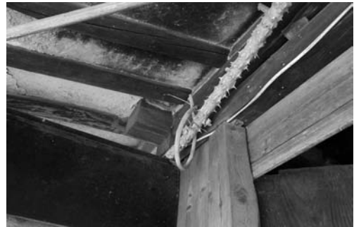
대문의 엄나무와 코뚜레 (청라면 내현리 2008.07)