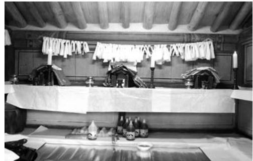
전횡장군 사당의 제 준비(2008. 3)