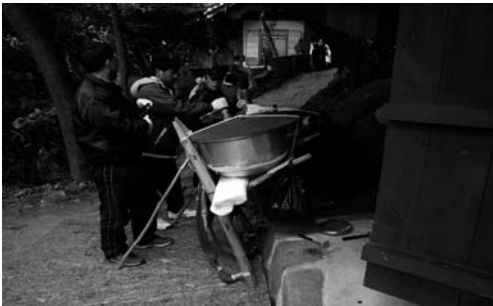
당 내릴 준비(2008. 3)

먼저 갈당에 가서 산신당에 절을 하고, 이어서 전횡장군놀던바위에 절을 하고, 모든 제물을 바위 밑에 넣고 넉적한 돌로 단단히 눌러놓은 후, 당산의 동쪽 능선으로 내려온다.