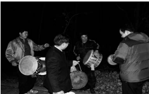
당집에서의 풍물패(2008. 2)