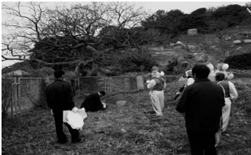
학교 앞 팽나무 제(2008. 3)

제상에 꼬두밥, 지미, 떡, 밤 대추 곶감, 쇠고기3덩어리. 술1잔을 올리고, 당주가 절을 두 번하고 끝낸다. 제물은 모두 땅바닥에 놓고 이동한다.