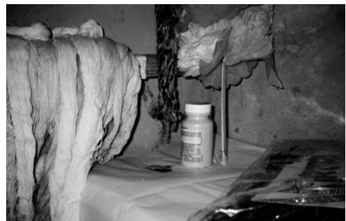
당집 내부(2002. 2)