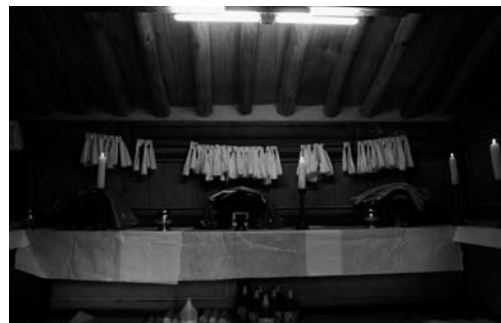
전횡장군 사당 내부(2008. 3)