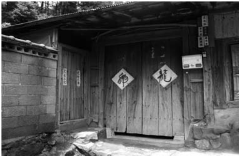
대문의 글씨(청라면 내현리, 2008.07)

문은 집안으로 들어오는 통로로 여러 잡귀가 들어 올 수 있기 때문에, 잡귀를 막기 위하여 龍虎라고 크게 써 붙이기도 하고, 대문 위에는 가시가 많이 달린 엄나무를 걸쳐 놓고, 코뚜레를 걸어놓기도 하였다. 龍虎는 용과 호랑이가 있으니 잡귀가 들어오지 말라는 의미이고, 엄나무는 가시가 많고 억세어 잡귀를 막는다는 의미이며, 코뚜레는 잡귀가 들어올 경우 코뚜레에 코가 껴이니 들어오지 말라는 의미이다.