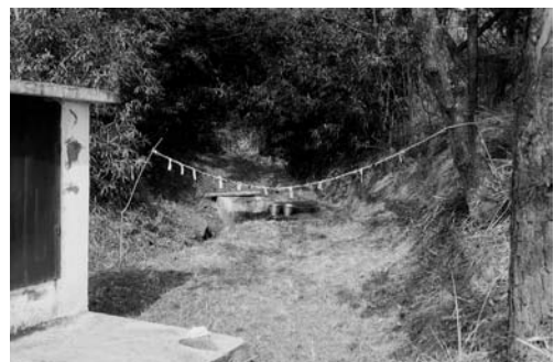
당샘과 금줄(1999. 2)