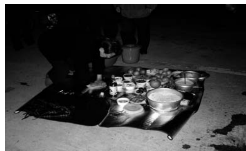
거리제(2005. 2. 22)