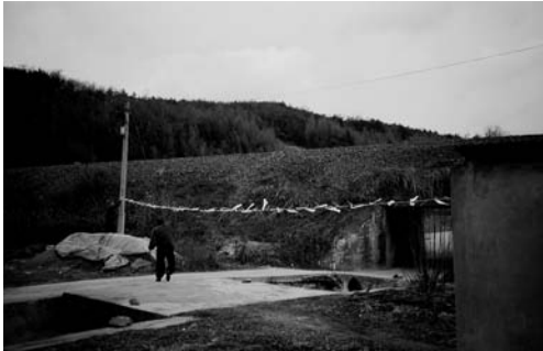
산제당 입구 금줄치기(2002. 2)