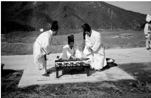
정자나무자리 거리제(1999. 3)