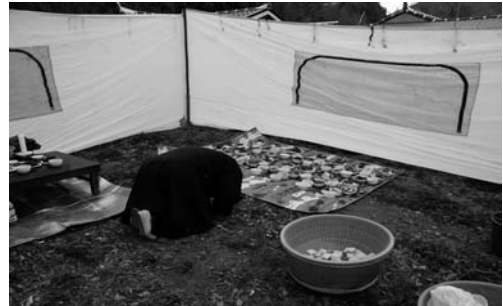
동쪽을 향한 안당제(2008. 3)