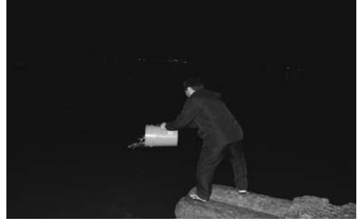
선창에서의 희식 모습(2008. 2)