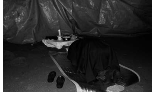
노구메 올리기(2008. 3)