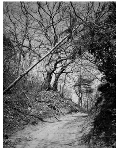
성황당(주산면 화평리, 1996.4)

서낭제를 지낸 제물은 집으로 가져오지 않고, 그대로 짚 위에 쏟아 놓고 돌아온다. 그러면 이튿날 아이들이 학교에 가다가 서낭제를 지낸 떡을 주워 먹는다. 지나가던