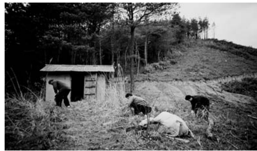
산제당 청소(2002. 2)