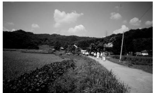
행진하는 모습(1995. 8)

또한 이렇게 해야 하늘이 기가 막혀서 옷기 때문에 비가 온다고도 믿으며, 지저분해야 하늘이 비를 뿌려 씻어낸다고 믿는다. 이런 복장은 제를 주관하는 할머니가 시키는 대로 한다.