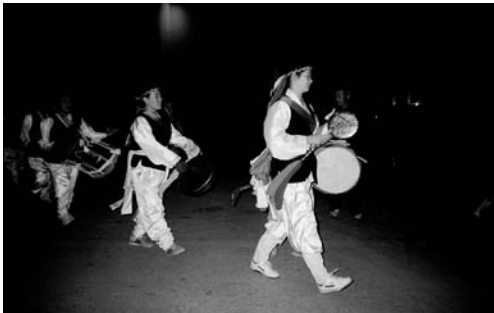
농악(1999. 3. 1)