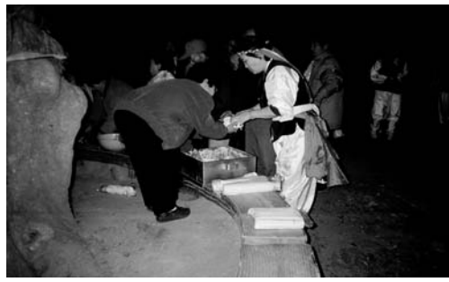
떡 나누기(1999. 3. 1)