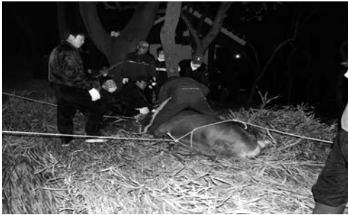
지태의 도살(2008. 3)

3월 22일 04시 40분쯤 지태 고기 진설을 모두 마치고 화장들은 가죽 닦아내는 작업을 계속했다. 당주가 칼판고사를 지내라고 지시하였다. 칼판고사는 칼판(도마)에 술을 한 잔 따라놓고 절하는 것으로, 칼판고사를 지낸 뒤에는 화장들이 고기를 먹어도 되는 것이다. 그러나 화장들은 너무 피곤하여 고기를 먹으려고 하지 않았다. 제상에 올리고 남은 고기는 모두 마대에 담겼다.