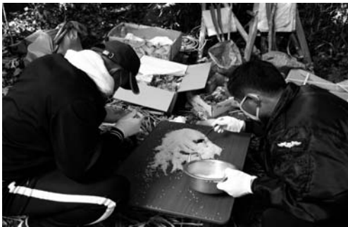
노구메 쌀 고르기(2008. 3)

고두메의 김이 오르자 시루 속에, 밤(1말쯤)과 대추(1되쯤)를 집어넣어 함께 찌낸다. 모든 제상에 올려지는 밤과 대추는 고두메와 함께 찌낸 것이다.