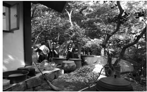
제물 준비(2008. 3)