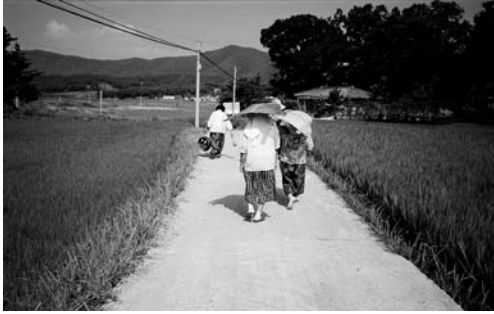
넷물로 행진(1994. 7)