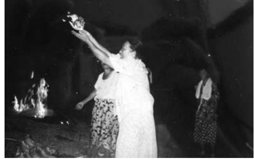
산에서의 기우제(1994. 7)