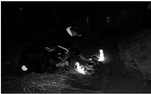
노구메 짓기(2008. 3)

당주는 노구메를 제외한 제물을 산신당에 차려놓고, 술을 따른 다음 두 번 절한다. 세 상에 모두 절한 다음 노구메가 익기를 기다렸다가 노구메가 다 되면 상에 받쳐들고 남쪽 제상부터 올린다. 각 제상마다(3상) 노구메의 뚜껑을 열고, 수저를 깨끗한 다음 젓가락을 산적 위에 올려놓고 2번 절하는 것으로 제를 마친다. 노구메는 갈당에만 올린다.