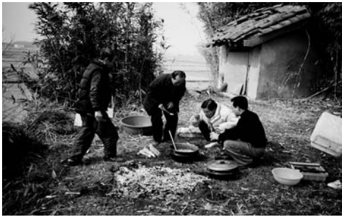
당제 준비(2002. 2)