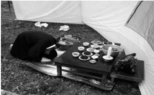
북쪽을 향한 안당제(2008. 3)

이어서 서쪽 제단에 제를 올린다. 서쪽 제단은 땅바닥에 비닐을 깔고 제물을 진설한다. 제물은 모두 14상으로, 각 상의 제물은 용왕제와 같이 떡, 지미, 고두밥 (밤 대추 꽃감과 같이), 간 처넵 허파 섞은 것, 술 한 잔이다. 제물을 진설하고 각 잔에 술을 따르고 당주가 2번 절하면 제는 모두 끝난다. 제를 마치면 간 처넵 허파 섞은 것과 과일 등 제물을 섞어 안당 앞 길 옆에 놓는다. 안당제가 끝나면 마을 사람들, 화장, 모두가 부담없이 제물을 먹는다. 2008년에는 12시쯤 제가 모두 끝났다.