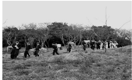
당내리는 행렬(2008. 3)