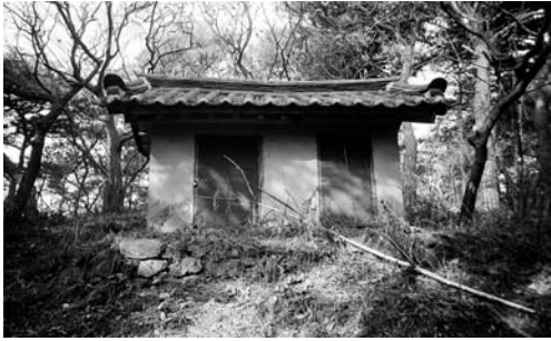
고잠마을 당집(1996. 1)