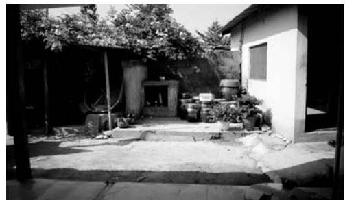
터주(주교면 신대리, 1994.7)

터주는 토주라고도 부르고 터주대감, 터주대장, 토주지신당산신령님, 대감신령님이라고도 부른다. 터주는 택지(宅地)의 주재신으로 나머지 사방지신(四方地神)을 다스리며, 집터의 안전과 보호를 주관한다. 터주의 신체(神體) 봉안은 가을에 수확한 가장 좋은 벼 이삭을 떨어져 작은 단지에 넣고, 짚으로 단지 위쪽을 덮은 것과, 장독대에 빈 시루를 놓고 그 안에 곡식을 담은 사발을 넣은 다음 그 위에 짚을