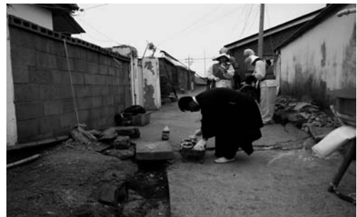
등장마당 제(2008. 3)