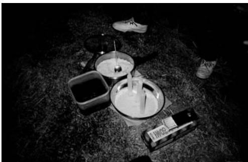
용왕제(오천면 영보리, 1999.2)

또한 당제를 지낼 때에 맞춰 개인이 깨끗한 날을 정해서 요왕제를 지낸다. 주로 음력 정월 열나흘날에 많이 지낸다. 저녁을 먹고 어둑어둑해질 무렵, 밥과 무나물만 가지고 요왕제 지낼 장소로 간다. 간혹 떡을 이고 가는 사람도 있다. 대성너머라고 하는 갯가에 가서 제물을 차려 놓고 제를 지낸다. 제가 끝나면 하얀 백지에 밥을 뽕뽕 뭉쳐 세 덩어리를 바닷물 속에 던져 넣는다.