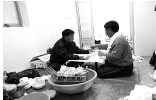
더덕산적 기름바르기(2008. 3)