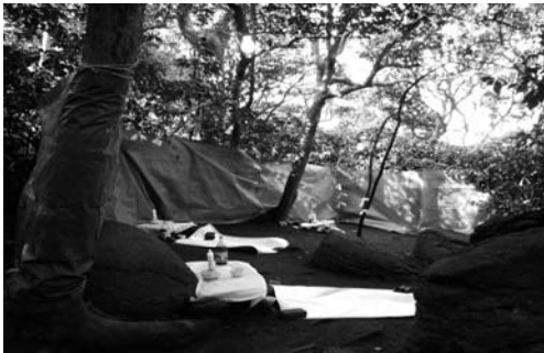
갈당의 제 준비(2008. 3)