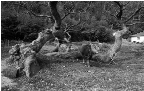
안당에 매어둔 지태(2008. 3)

기본적인 제물의 진설을 마치면 당주가 전횡장군신위에 올릴 남자용 바지저고리, 당산신위와 도당신위에 바칠 여자용 치마저고리를 정성스레 가져와 감실 위에 올려놓고 절한다.