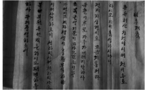
기우제 축문(화산동 굴고개)