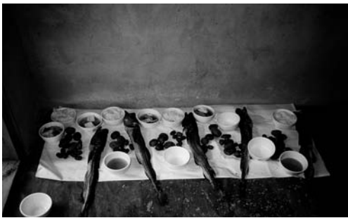
서쪽 바닥 제물(2002. 2)