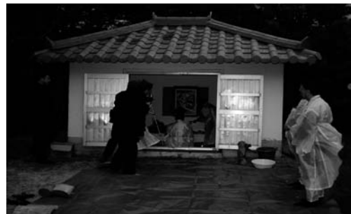
산신제의 시작(2005. 2. 22)