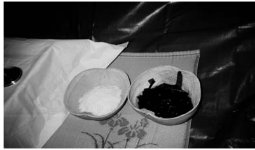
당제의 밥과 국(1999. 2)