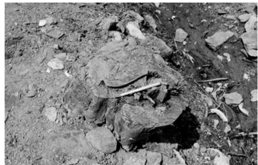
동티의 방지(웅천읍 구룡리)