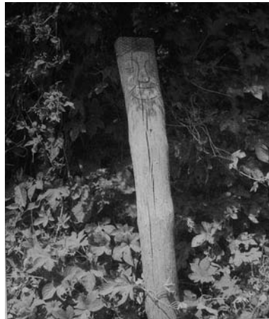
효자도의 장승