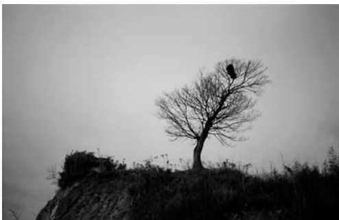
조잠 당집과 신수(1996. 3)