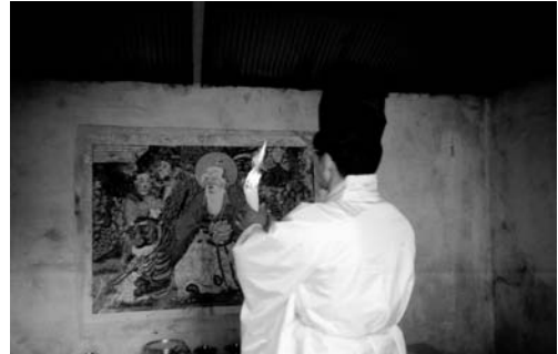
산제 소지(1999. 3)