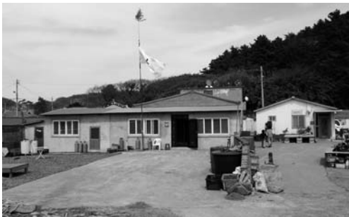
당주집의 당기와 황토(2008. 3)

외연도에 도착하여 제물은 당주 집으로 옮기고, 지태는 크레인으로 내려 안당에 묶어 두었다. 지태는 언제나 안당에 묶어둔다고 한다.