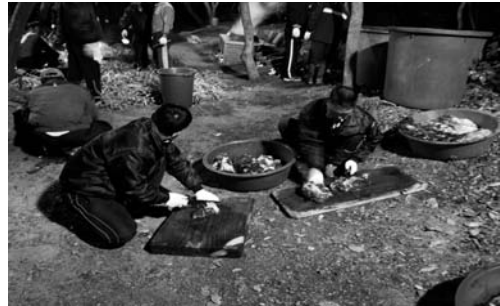
지태 제물 준비(2008. 3)