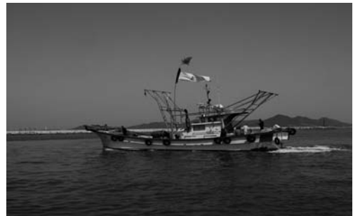
장배의 어항 출항(2008. 3)