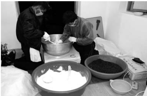
팔떡 얹히기(2008. 3)

전횡장군 사당의 모든 신위에 팔떡을 올리고, 분향하고, 술을 올리고 절을 마치면 (절은 북쪽으로 2번, 서쪽으로 2번, 동쪽으로 2번) 당산에서의 제가 모두 끝나는 것이다. 제를 마치는 시각이 아침 6시쯤이었다.