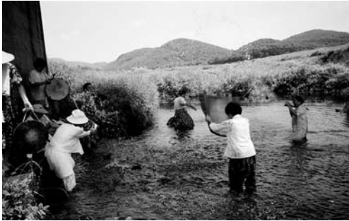
넷물에서의 기우제(1994. 7)