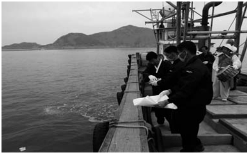
짐과 쌀 던지기(2008. 3)