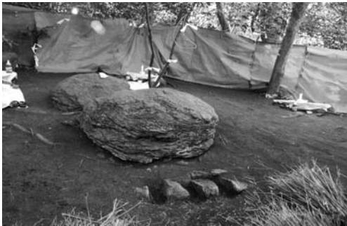
갈당 모습(2008. 3)

이 화덕의 남쪽으로 전횡장군 놀던 바위라고 불리는 네모난 큰 돌이 있다. 이 돌의 동쪽 부분에는 구멍이 뚫려 있어 쇠 뼈를 묻는 장소로 이용하고, 바위 동쪽 앞에는 이제까지 바쳐진 쇠뼈가 수북히 쌓여 있다. 이 바위의 서쪽 부분에 제상을 차린다