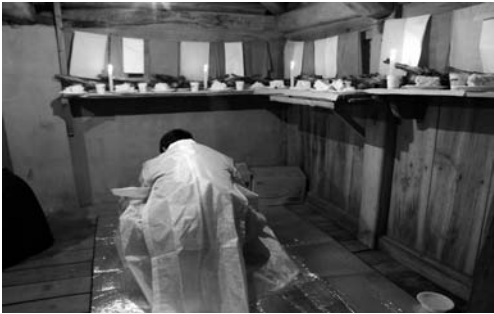
당제 올리는 모습(2008. 2)