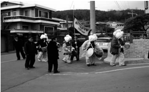
시내를 도는 풍물패(2005. 2. 22)

유학 ○○○ 감히 산신지위에 고하나이다. 산명은 진북(鎮北)이니 영험을 발양하시어 길상을 내려주시고 진실로 묵묵히 도와주시어 마땅히 우리들의 농사와 상업을 때때로 어루만지고 윤택케 하고 국가에 명성을 거양케 하며 주운(舟運)과 차량이 이롭게 다니게 하고 백성과 만물이 다 창달하며 성실과 안녕을 유지하고 복 받음을 한이 없이 되기를 이 상달에 분향하고 여러 가지와 잔을 올리오니 흠향하소서.