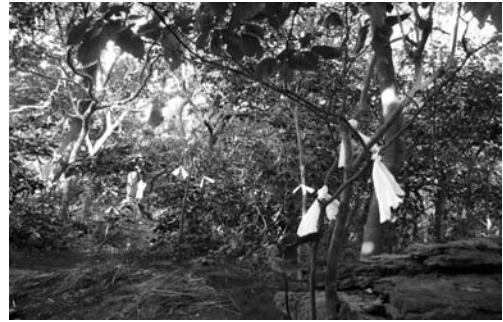
갈당의 길지(2008. 3)

전횡장군놀던바위 서쪽, 전횡장군 사당 정 북쪽으로 큰 바위가 있는데 이 바위를 김서방바위라고 부른다. 2008년 당주의 말에 의하면 ‘옛날 외연도에 김서방이 살았는데, 글을 많이 알기는 했어도 풀지를 못해서 아주 어렵게 살았다. 배가 고파서 전횡장군 놀던바위 밑에 있는 제물을 가져다 먹고 굶어 죽었다. 그 김서방이 있는 바위를 김서방 바위라고 한다’고 하였다. 이 김서방바위 위에 약간의 제물을 차린다.