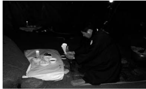
지미 올리기(2008. 3)

다음으로 당주는 화장과 함께 지미, 고두밥, 밤, 대추, 꽃감 등 제물을 차려 전횡장군 사당으로 내려가 갈당에서와 같이 제를 올렸다. 전횡장군 사당 바닥에 있는 여섯 신위의 상에는 복잡하여 고두메 위에 밤, 대추, 꽃감을 함께 놓아 제물을 차렸다. 전횡장군 사당에서는 징을 올리지 않았다.