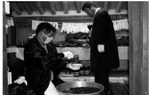
전횡장군 사당에 팔떡 올리기 (2008. 3)