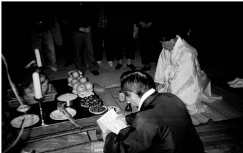
정자나무제(1999. 3. 1)