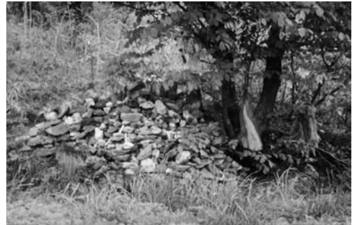
성황당(주산면 금암리, 1998)