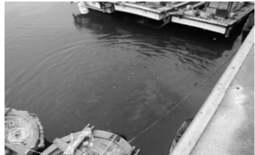
용왕제 제물의 희식(2008. 3)