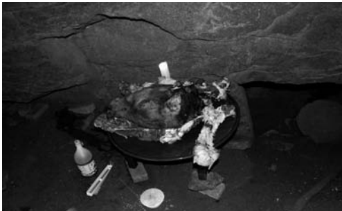
전횡장군 놀던 바위에 올려진 제물(2008.3)