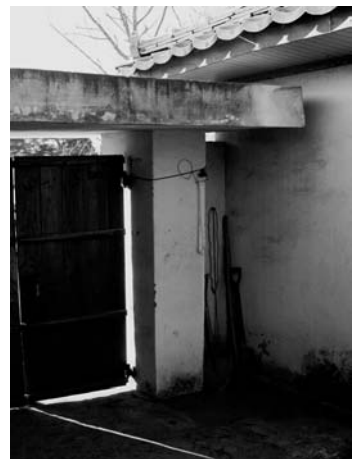
문신을 위한 폐백실 (화산동, 1994.1)