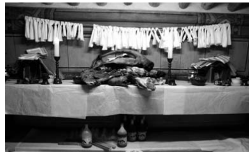
전횡장군 사당에 올려진 제물 (2008. 3)