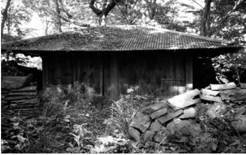
당집(2007. 5. 26)