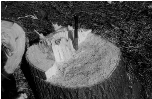
동티의 방지(웅천읍 황교리, 1999.2)

이 동티를 두려워하여 집 주변에 아예 나무를 심지 않는 경우도 있고, 베지 않으며, 부득이 벨 경우에는 벤 그루터기에 왕소금을 뿌리고, 칼, 도끼, 낫 등 쇠를 박고, 쇠뿔을 발라 놓기도 한다. 농촌 지역에서는 근래에도 볼 수 있는 모습이다.