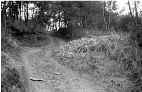
성황당(웅천읍 두룡리, 1991)

1970년대 새마을운동으로 대부분의 성황당이 파괴되었고, 대부분 마을에서 서낭제를 지내지 않는다.