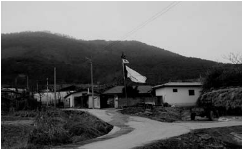
당주집에 걸린 대동기(1999. 2)

갈두동에 거주하는 대표 ○○○ 외 모든 사람들은 삼가 목욕재계하고 백배하며 감히 우리 동중(洞中)의 괴목신령님께 고하나이다. 앞드려 헤아리건대 영령이시어 정기를 하늘로부터 명을 받아 우리 동중에 임하사 목덕(木德)의 은혜를 힘입어 사절(四節)을 온화한 봄철과 같이 하여 소리가 없어도 들리고 말이 없어도 퍼지니 기후가 화순하고 오곡이 풍요롭게 결실하며 삼재를 소멸하고 백록을 강인함이 없게 하고 부모는 안락하고 자손은 번영하며 질병과 전염병을 흠어 모두 멀리 보내고 일년 내내 편안함과 태평케 함이 이는 누가 주는가, 진실로 신령님의 힘입음이라. 그러므로 이 상달 길한 날을 가려 예로 정수하여 보새(報賽)하고 감히 비박(菲薄)으로 정중히 펴니 그 신령님으로 말미암아 한 가지 격사(格思)하오니 그 모든 것을 도우시고 흠향하소서.