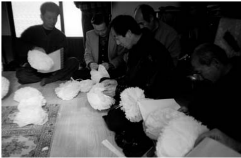
제 준비(1999. 3)

서왕의 기력으로 태풍을 퇴척케 하옵시고, 물침 물범하며 산마수요가 천음하야 붕괴치 않게 하고, 우습(장마)과 음사며 불길한 일은 원방에 유산케 하고, 동리에 염염한 기운은 풍전에 지엽과 같이 하고, 참질을 속히 구제하야 일촌을 보우하사 그 가명을 애호하시고 오방지신을 신뢰케 하시기를 지유사는 삼가 청작과 모든 음식을 차려 비오니 흠향하소서.