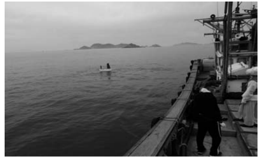
띠배 배송보내기(2008. 3)