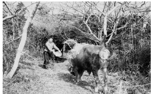
지태 씻기(2008. 3)