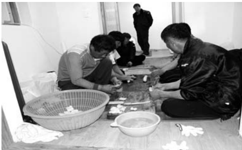
지미 만들기(2008. 3)

이어서 김서방바위에 술, 지미, 고두밥, 대추, 꽃감을 올려 놓았다. 당주 화장 모두 절은 하지 않았다.