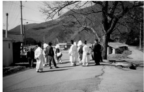
참나무 밑 거리제(1999. 3)