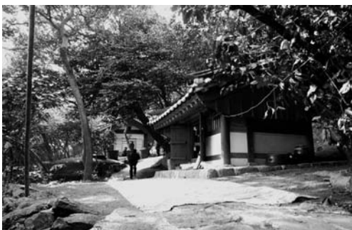
전횡장군 사당(2008. 3)

공간의 바닥은 흙으로 되어 있고, 서쪽 부분에 3개의 항아리와 2개의 플라스틱 통이 놓여 있다. 이 통은 과거 당제에 바쳐진 옷을 넣어두는 것이다. 옷을 넣어 두는 항아리는 사당의 동쪽 밖에도 2개가 놓여 있다.