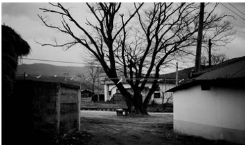
정주나무 금줄치기(2002. 2)